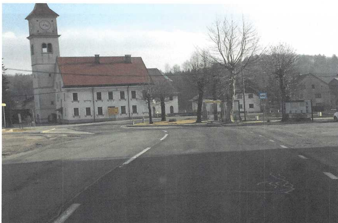
Območje odcepa proti Zalogu