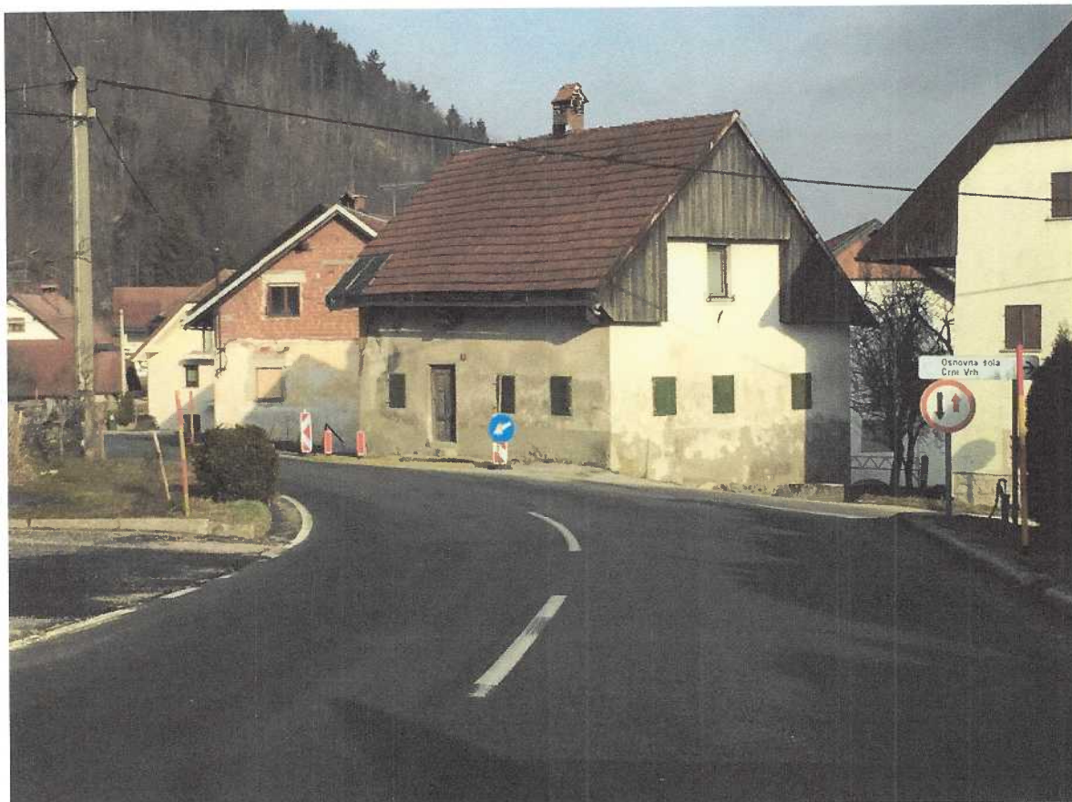
Območje objekta Črni vrh št.70

tel.: + 386 (0)5 338 00 00 fax: + 386 (0)5 302 44 93 e - mail: projekt@siol.net