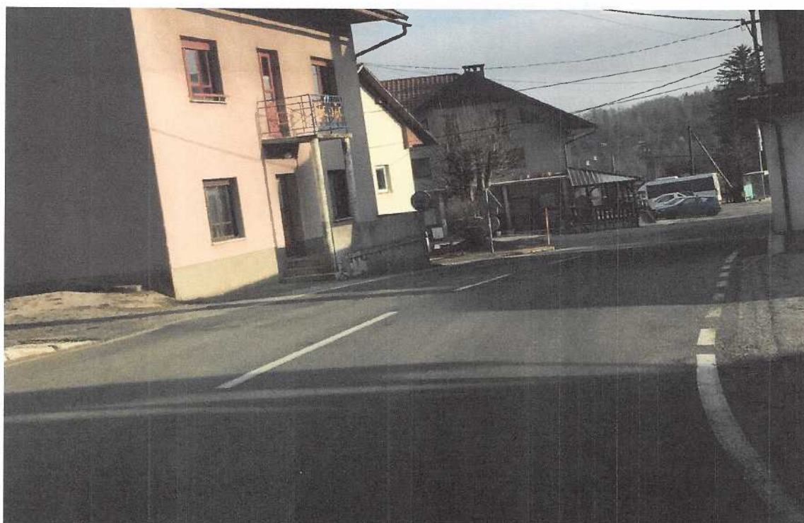
Osrednji del naselja

tel.: + 386 (0)5 338 00 00 fax: + 386 (0)5 302 44 93 e - mail: projekt@siol.net